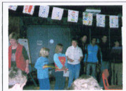
das Friedensbrot wird an die v.Galen-Schule übergeben