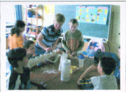
... backen ein Friedensbrot