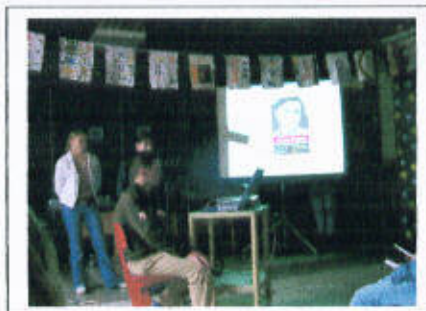
Geschichte der Anne Frank