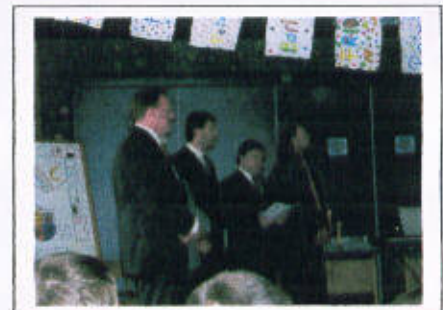
die Vertreter der Glaubensgemeinschaften singen Schalom chaverim