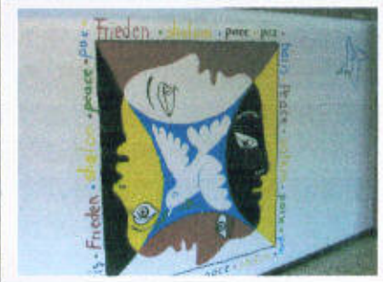
"Kinder dieser Welt....."