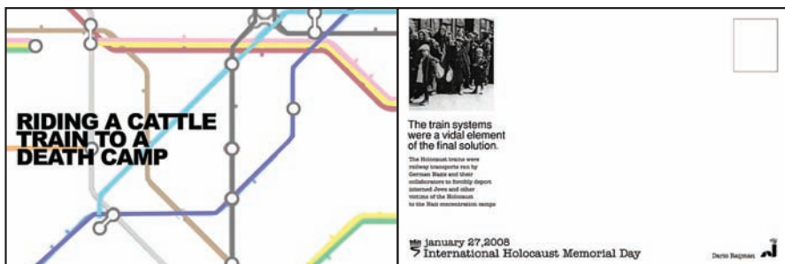
“גלויות”: סטודנטים מישראל, מפולין ומאנגליה השתתפו בפרויקט עיצוב לרגל יום הזיכרון הבין-לאומי לקרבנות השואה.

של ערבים ויהודים באושוויץ. באתר תהיה גם אנקדוטה מעניינת על לימוד השפה הערבית בגטו טרזיינשטט, וכן תערוכות של יד ושם כגון התערוכה “בְּסָה: מילה של כבוד – מוסלמים אלבנים שהצילו יהודים בשואה” (ראו עמ' 12).