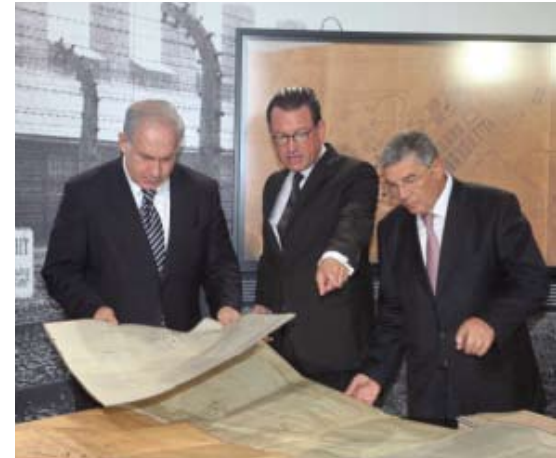
■ מימין לשמאל: יושב ראש הנהלת יד ושם אבנר שלו, העורך הראשי של העיתון הגרמני Bild קאי דיקמן וראש הממשלה בנימין נתניהו מתבוננים בסרטוטים המקוריים של אושוויץ-בירקנאו.

בשנת 2008 נמצאו בדירה נטושה בברלין 29 סרטוטים מצהיבים ומקוריים של מבנים במחנה אושוויץ, רובם הוכנו בסתיו 1941. ייחודם העיקרי של הסרטוטים הוא בתארוך המוקדם למדי של חלק מהם לעומת סרטוטי אושוויץ שהיו ידועים עד כה. הסרטוטים הם בקנה מידה 1:100, ובהם אחת מתכניות המחנה מ-23 באוקטובר 1941 הנושאת הערת שוליים וחתימה של הימלר בצבע ירוק. העיתון הגרמני הנפוץ Bild השייך לתאגיד התקשורת הגרמני "אקסל-שפרינגר" קנה את הסרטוטים ופרסם את דבר מציאתם בהבלטה בנובמבר 2008. הסרטוטים והמסמכים שנתקבלו אתם נבדקו בארכיון הפדרלי הגרמני כדי לאשר את מקורותם ואז הועברו למשמרת עולם ביד ושם. יושב ראש הנהלת יד ושם אבנר שלו ומנהל אגף הארכיונים ד"ר חיים גרטנר השתתפו בטקס. "הסרטוטים המקוריים של אושוויץ הם סמל גרפי