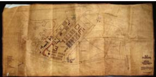
■ התכנית הכללית של מחנה אושוויץ I, לרבות מבנה המפקדה הענקי שלא נבנה, 30 באפריל 1942

חשוב הממחיש את התכנון השיטתי והמתמשך של 'הפתרון הסופי' על ידי הגרמנים", אמר שלו. "אני מברך על החלטת עורך העיתון להעביר את הסרטוטים למשמרת עולם ביד ושם, להחלטתו יש משמעות מיוחדת". הסרטוטים יוצגו בפעם הראשונה בישראל בתערוכה שתפתח ביד ושם בינואר 2010 לציון 65 שנים לשחרור אושוויץ.