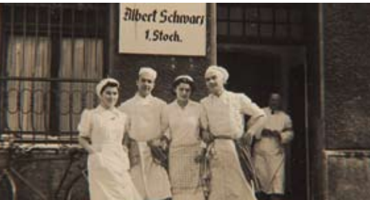
יהודים לומדים מקצוע: בית ספר לטבחות, מהסרט כישלון אנושי

שוב הוא יוצא למסע בעקבות תערוכה שהציגה הפעם מסמכים ותיעוד מדוקדק על גזל נכסי היהודים שאזרחים רבים בגרמניה הנאצית נהנו ממנו. "ההחרמה הכוללת של המשפחות היהודיות, הקרויה 'אריאניזציה' כפי שעולה מתוך סרטי כישלון אנושי , לא הייתה ידועה כלל לרוב הגרמנים, בייחוד משום שהמסמכים נשמרו סגורים וחבויים עד לא מכבר", חושף ורהובן, "לכן היה לי חשוב במיוחד לעשות את הסרט עכשיו, בסגנון קולנועי ישיר אבל רזה, כדי להגיע לקהל צעיר. מהסרט עולות אמת אנושית מרה ושאלות כואבות על אשמה ועל האופורטוניזם של 'האנשים הרגילים' בחברה הגרמנית בזמן מלחמת העולם השנייה".