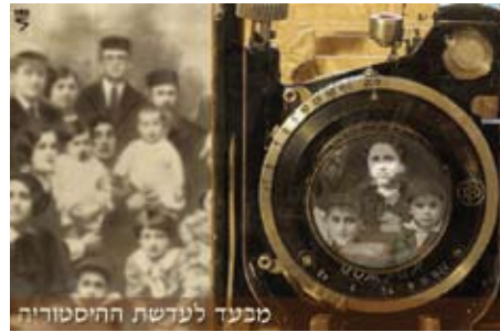
מבעד לעדשת היסטוריה

■ אתר יד ושם עוצב ונבנה מחדש לא מכבר, ואתר חדיש וידידותי עומד כעת לרשות הגולשים. סרגלי הניווט הברורים וטכנולוגיית החיפוש המתקדמת מבטיחים למיליוני המבקרים באתר מדי שנה גישה מרבית למאגרי המידע העצומים של יד ושם.